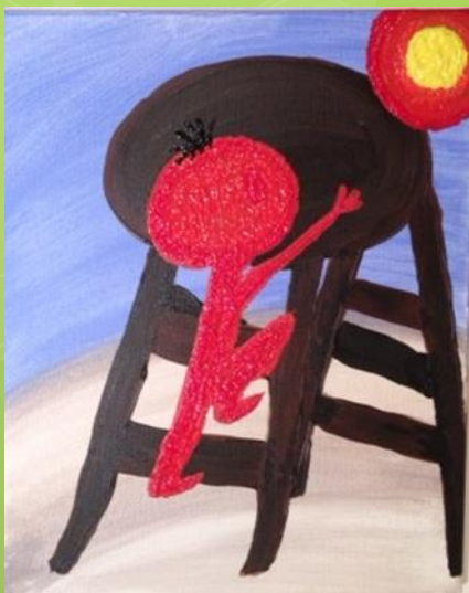
"Taburet". Billedet handler om at klare det uoverstigelige.

Udover socialrådgivning tilbyder CSM-Øst psykologfaglig behandling, frivillig rådgivning, selvhjælpsgrupper, caféaftener samt specialrådgivning og udredning gennem VISO. Find flere oplysninger på www.csm-ost.dk